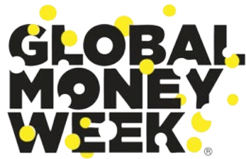
Ejemplo del logo en dos variaciones de color